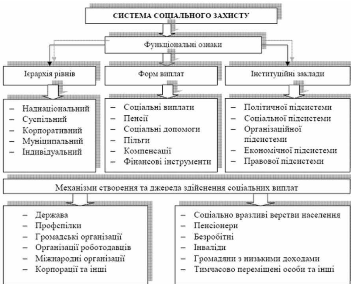
Рис. 1.1. Складові системи соціального захисту населення

передбачає реалізацію функцій соціального сприяння і захисту на різних рівнях та за участю різних суспільних інституцій (рис. 1.1).