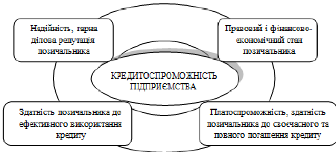
Рисунок 1.1 - Комплексний підхід до сутності категорії "кредитоспроможність підприємства" (розроблено на основі [34])

Відзначимо, що тлумачення кредитоспроможності підприємства має комплексний характер, що відображено на рис. 1.1.