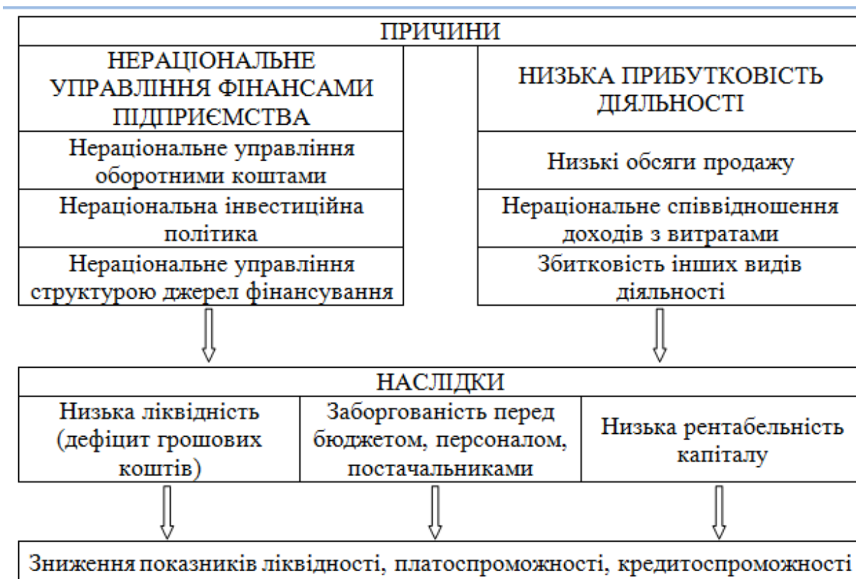
Рис. 3.1 – Основні причини зниження кредитоспроможності підприємства

Наступний блок причин пов'язаний з управлінням прибутковістю діяльністю підприємства. Зниження обсягів реалізації продукції, особливо нижче порогу рентабельності, призводить до зменшення валового прибутку, прибутку від операційної діяльності (surl.li) та навіть отримання збитків.