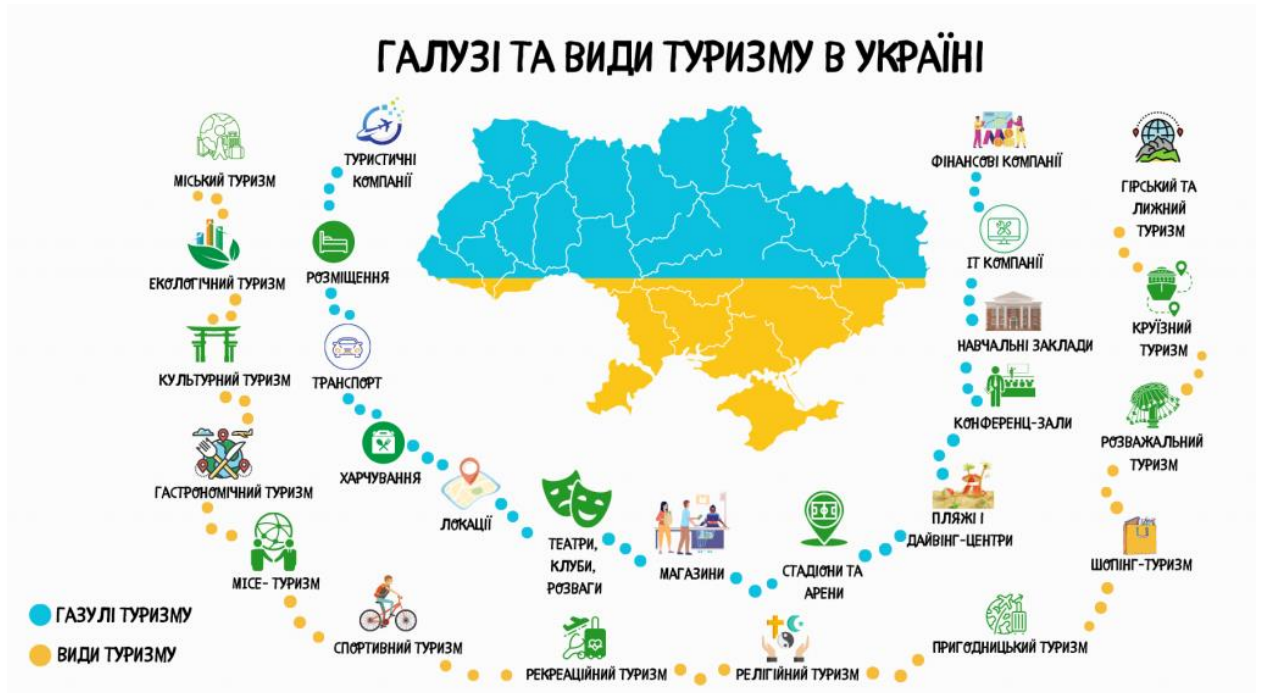
Рис. 1.3 – Галузі та види туризму в Україні

зближення народів, запобігання конфліктності і нетерпимості, виховання поваги та толерантності.