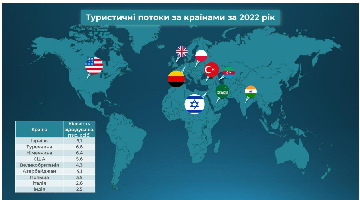
Рис. 1.7 – Динаміка зміни туристичних потоків за країнами станом на 2022 р.