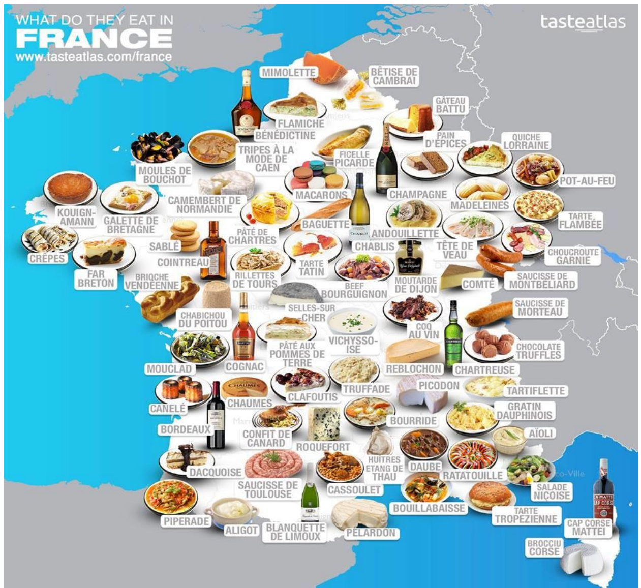
Рис. 2.3 – Гастрономічний образ Франції

Іноземці формують уявлення про Францію, серед інших аспектів, на основі її знаменитих гастрономічних традицій і можливостей насолоджуватися французькими делікатесами (рис. 2.3) [23].