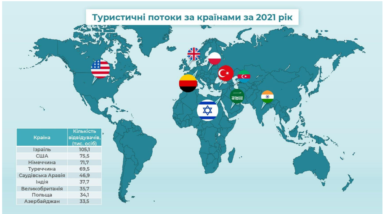
Рис. 1.6 – Динаміка зміни туристичних потоків за країнами станом на 2021 р.

Динаміка зміни туристичних потоків за країнами станом на 2021 р. та 2022 р. наведена на рисунках 1.6 та 1.7, відповідно [17].