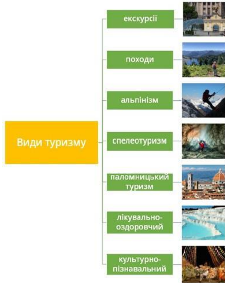
Рис. 1.2 – Види туризму залежно від мети подорожі [2]

Туризм є однією з найбільш динамічних, прибуткових, популярних і перспективних сфер розвитку сучасного світу та України. Галузі та види туризму в Україні представлені на рисунку 1.3.