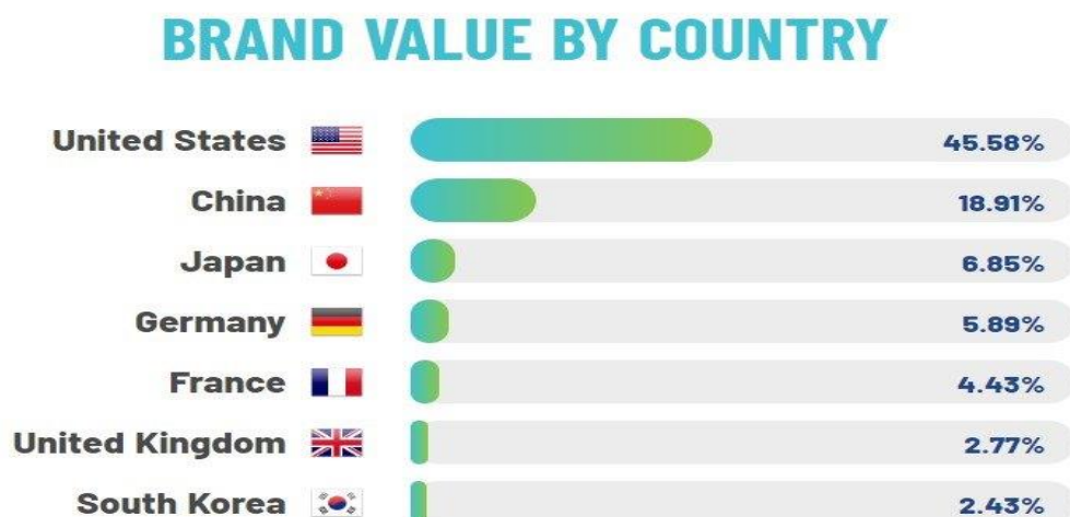
Рис. 1.8 – Туристична привабливість країн світу, виражена в показнику бренду країни, станом на 2020 р.

Туристична привабливість країн світу, виражена в показнику бренду країни, наведена графічно на рисунку 1.8 [18].