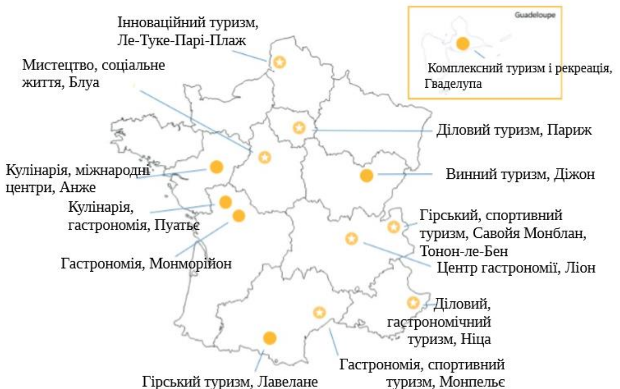
Рис. 2.2 – Основні центри розвитку туризму у Франції за регіонами

Основні центри розвитку туризму у Франції за регіонами наведені на рисунку 2.2 [1].